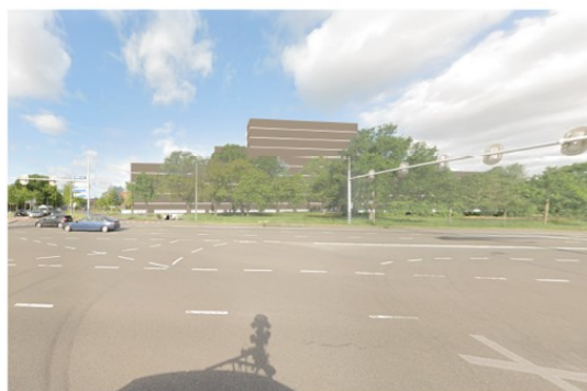
Vanaf de Ceintuurbaan