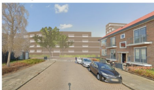
Vanaf de Isaac van Hoornbeekstraat