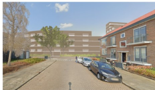
Vanaf de Isaac van Hoornbeekstraat