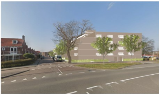
Vanaf de Meppelerstraatweg