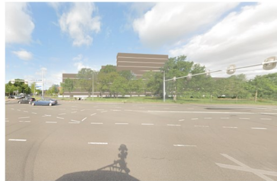
Vanaf de Ceintuurbaan